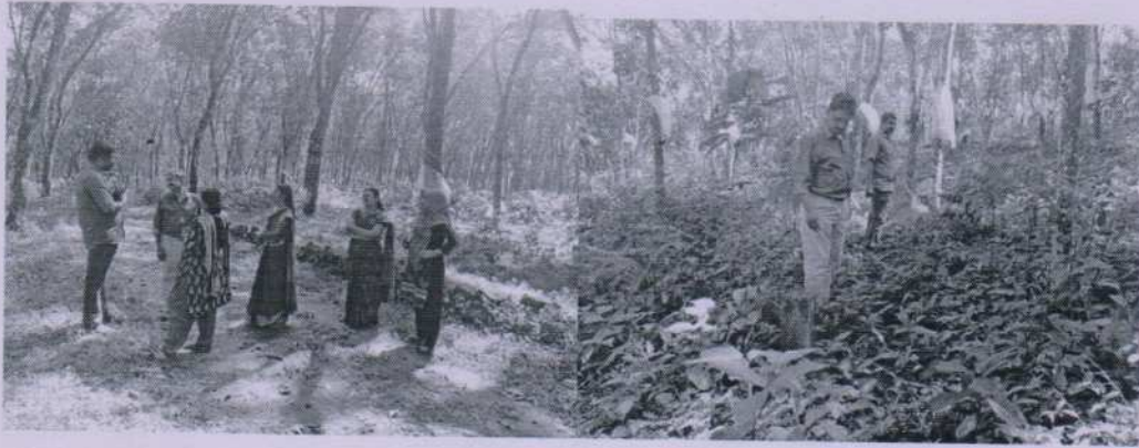
Consultation with Title Holders